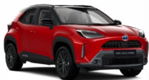
2SZ Érzéki vörös fekete tetővel

Gyöngyház Elérhető az Executive, Adventure, GR SPORT és Premiere Edition felszereltségeknél Felár nélkül