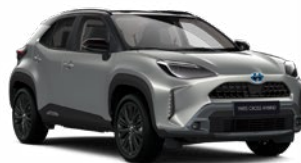
2VU Palladium ezüst fekete tetővel

Egyedi Elérhető az Executive, Adventure, GR SPORT és Premiere Edition felszereltségeknél Felár nélkül