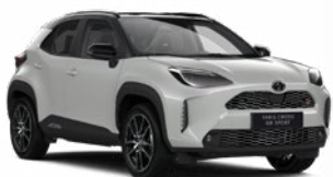
2RZ Higanyszürke fekete tetővel

Metál Elérhető az Executive, Adventure és Premiere Edition felszereltségeknél Felár nélkül