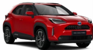
3U5 Érzéki vörös

Metál Elérhető az Active, Comfort és Executive felszereltségeknél 145 000 Ft