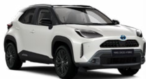
2PU Gyöngyházfehér fekete tetővel

Metál Elérhető az Active, Comfort és Executive felszereltségeknél 145 000 Ft