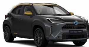
2UA Hamuszürke aranymetál tetővel

Metál Elérhető az GR SPORT felszereltségeknél Felár nélkül