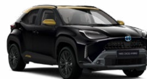
2UB Éjfekete aranymetál tetővel

Metál Elérhető az Adventure és Premiere Edition felszereltségeknél Felár nélkül