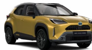
2VS Aranymetál fekete tetővel

Metál Elérhető az Executive, Adventure, GR SPORT és Premiere Edition felszereltségeknél Felár nélkül