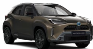
2TK Barnászöld fekete tetővel

Metál Elérhető az Executive, Adventure és Premiere Edition felszereltségeknél Felár nélkül