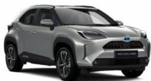
1L0 Palladium ezüst

Metál Elérhető az Active, Comfort és Executive felszereltségeknél 145 000 Ft