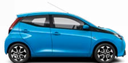
8W9 Ciánkék metálfényezés csak az x-play változatban rendelhető 105 000 Ft