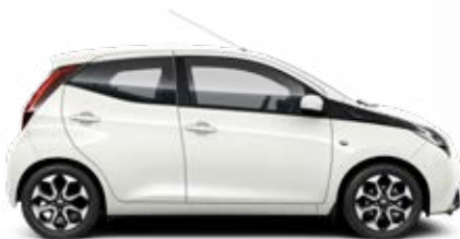
068 Hófehér felár nélkül