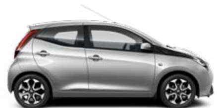
1E7 Szaténézüst metálfényezés 105 000 Ft