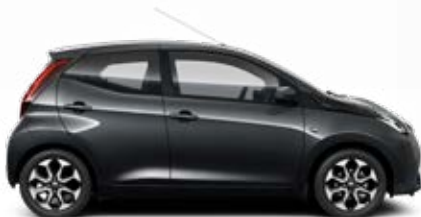
1E0 Antracitszürke metálfényezés 105 000 Ft