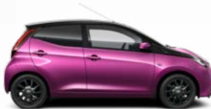
9AC Magenta metálfényezés csak az x-cite bi-tone (kéttónusú) változatban rendelhető 105 000 Ft