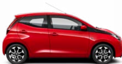
3P0 Tűzpiros 40 000 Ft