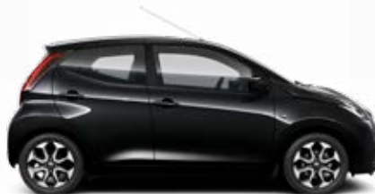
211 Éjfekete metálfényezés 105 000 Ft