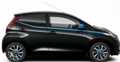
211 Éjfekete ciánkék díszítéssel metálfényezés csak az x-treme változatban rendelhető