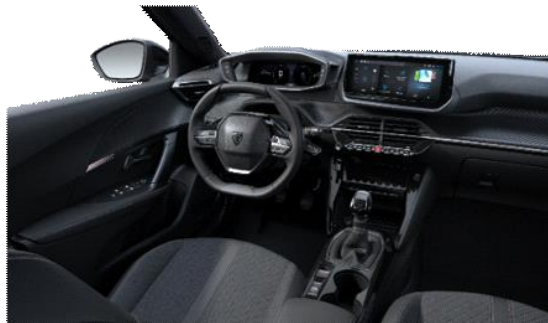
LOMSA szövetkárpit 'quartz' díszvarrással Allure széria