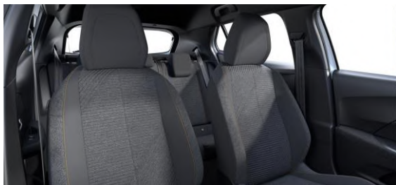
Renzo szövetkárpit Style széria