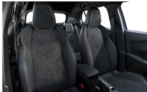
Alcantara ICONIUM kárpit 'adamite' díszvarrással GT opció