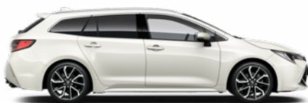
089 Platina gyöngy 300 000 Ft