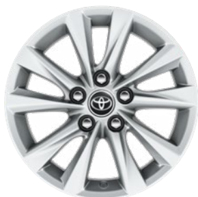
16" könnyűfém keréktárcsák 205/55 R16 gumiabronccsal Alapfelszereltség: Comfort és Comfort + Tech