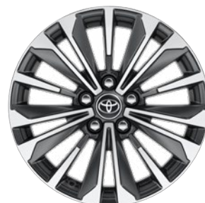
17" könnyűfém keréktárcsák 225/45 R17 gumiabronccsal Alapfelszereltség: Style