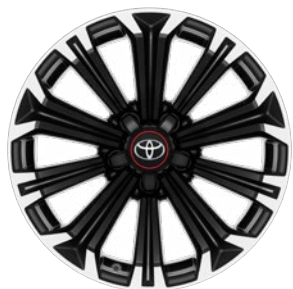
17" könnyűfém keréktárcsák 225/45 R17 gumiabroncsok Alapfelszereltség: GR SPORT