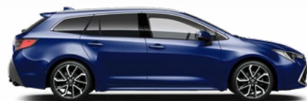
8Y8 Boróka metál* 200 000 Ft