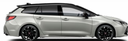
2RZ GR SPORT Higanyszürke/ Fekete tető Elérhető a GR SPORT felszereltségeken