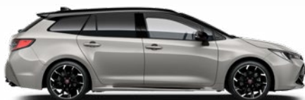
2RD GR SPORT Krómezüst/ Fekete tető Elérhető a GR SPORT felszereltségeken