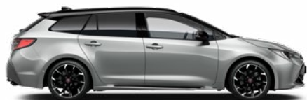
2TX GR SPORT Prémium ezüst/ Fekete tető Elérhető a GR SPORT felszereltségeken