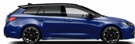
2VL GR SPORT Boróka metál/ Fekete tető Elérhető a GR SPORT felszereltségeken