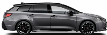
2MB GR SPORT Szürke metál/ Fekete tető Elérhető a GR SPORT felszereltségeken