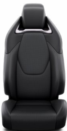
Bőr ülésborítás, fekete Alapfelszereltség az Executive és Hybrid Executive felszereltségnél