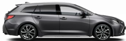
1G3 Szürke metál* 200 000 Ft