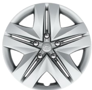
16" acél keréktárcsák 205/55 R16 gumiabroncsok dísz tárcsával Alapfelszereltség: Active