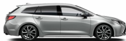
1L0 Palladium ezüst* 200 000 Ft