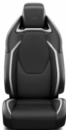
Sötétszürke szövet és szintetikus bőr ülésborítás GR Sport logoval Alapfelszereltség a GR Sport és GR SPORT Dynamic felszereltségnél