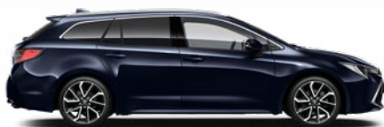
8X8 Sötétkék mica* 200 000 Ft