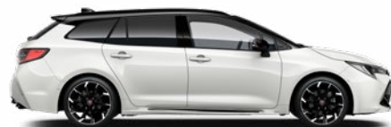
2NR GR SPORT Pure/ Fekete tető Elérhető a GR SPORT felszereltségeken