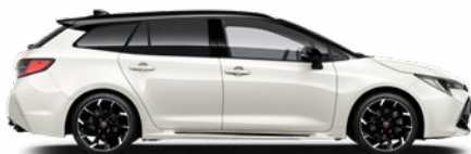
2PU GR SPORT Fehér/ Fekete tető Elérhető a GR SPORT felszereltségeken