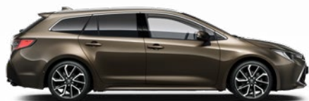
6X1 Barnászöld** 200 000 Ft