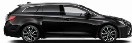
209 Éjfekete* 200 000 Ft