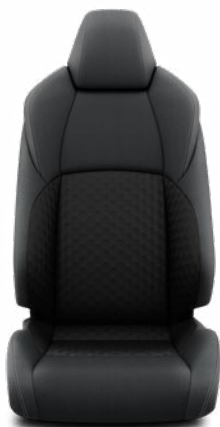
Fekete szövet ülésborítás Alapfelszereltség az Active felszereltségnél