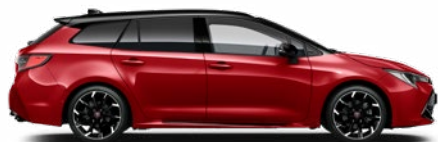
2SZ GR SPORT Passion/ Fekete tető Elérhető a GR SPORT felszereltségeken