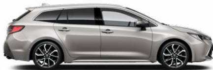
1J6 Krómezüst o 300 000 Ft