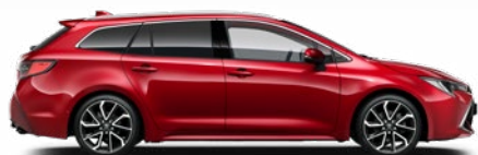
3U5 Érzéki vörös* 300 000 Ft