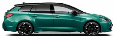
M28 Racing green / Fekete tető különleges fényezés Elérhető a GR SPORT felszereltségeken