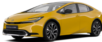
5C5 Mustársárga metál* 270 000 Ft