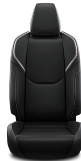
Fekete szintetikus bőr ülésborítás Széria az Executive szereltségben