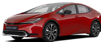
3U5 Érzéki Vörös 350 000 Ft