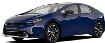
8Q4 Sötétkék felár nélkül