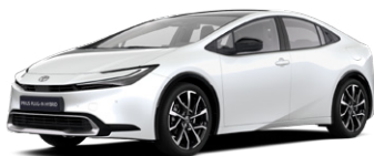
089 Gyöngy fehér 350 000 Ft