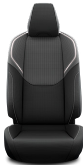
Fekete szövet ülésborítás Széria a Comfort és Prestige szereltségekben