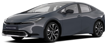
1M2 Hamu szürke* 350 000 Ft