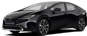
218 Fekete metál* 270 000 Ft