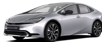
1L0 Prémium ezüst* 270 000 Ft