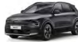
Interstellar Gray (AGT)