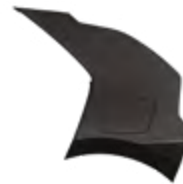
Aurora Black Pearl (ABP) Niro HEV/PHEV modellekhez rendelhető