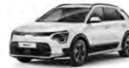
Clear Snow-White Pearl (SWP)