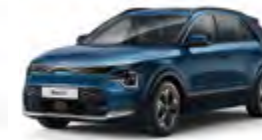
Mineral Blue (M4B)