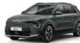
Cityscape Green (CGE)