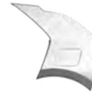
Steel Gray (KLG) Niro EV modellekhez rendelhető