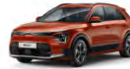
Orange Delight (DRG)