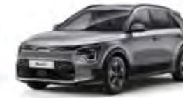
Steel Gray (KLG)