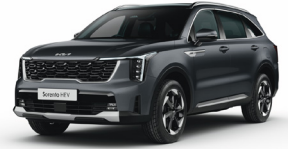
Interstellar Gray (AGT) PRÉMIUM METÁL