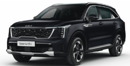
Aurora Black Pearl (ABP) METÁL