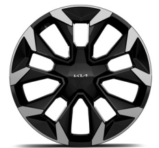
20" könnyűfém keréktárcsa (UV)