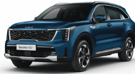
Mineral Blue (M4B) PRÉMIUM METÁL