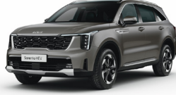
Volcanic Sand (BN4) PRÉMIUM METÁL