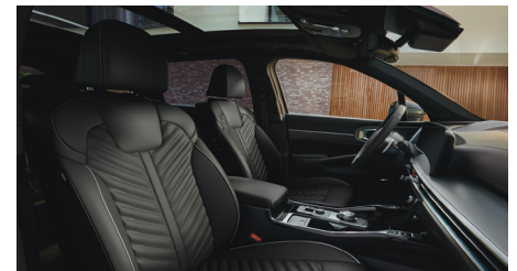
KRYPTONITE opcionális fekete Nappa bőr