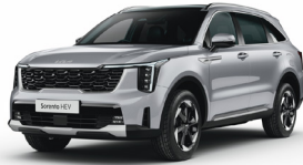
Silky Silver (4SS) METÁL