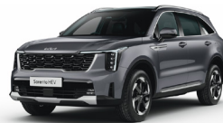
Steel Grey (KLG) METÁL