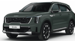
Cityscape Green (CGE) METÁL