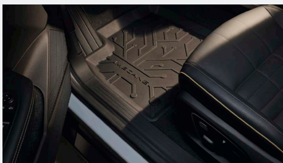
4 db-os gumi- vagy textilszőnyeg szett 24 890 Ft

A tartozékosomagban történő vásárlással legalább 10%-ot spórolhat!