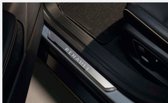
226 990 Ft

5 A feltüntetett árak az RN Hungary Kft. ajánlott árai, a tartozékok és tartozék csomagok beszerelési munkadíjáról érdeklődjön a Renault márkakereskedésekben!