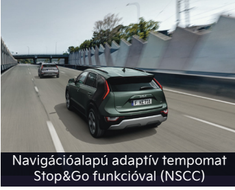
Navigációalapú adaptív tempomat Stop&Go funkcióval (NSCC)