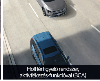
Holtterfigyelő rendszer, aktívfékezés-funkcióval (BCA)