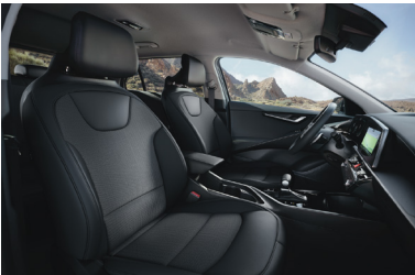
ESSENCE/ SILVER fekete szövet kárpit (sztfender)