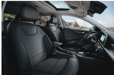
GOLD / PLATINUM fekete szintetikus bőr-szövet kárpit (sztfender)