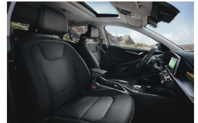
KRYPTONITE fekete szintetikus bőr kárpit (sztfender választható)