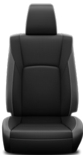
Kéttónusú perforált bőr Alapfelszereltség az Invincible modellváltozaton