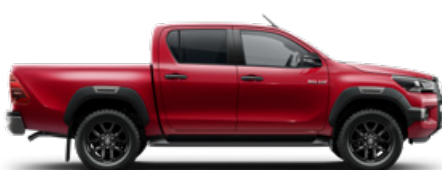
3T6 Lávavörös Metálfényezés nettó 255 000 Ft bruttó 323 850 Ft