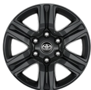
17" sötétszürke könnyűfém keréktárcsa (6 küllős) Alapfelszereltség az Active modellváltozaton