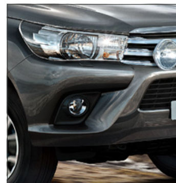
Ködlámpák 365 400 Ft