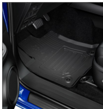
Gumiszőnyeg 39 200 Ft