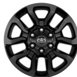
18" fekete könnyűfém keréktárcsa (5 küllős) Alapfelszereltség az Invincible modellváltozaton