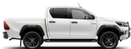
040 Hófehér Alapfényezés felár nélkül