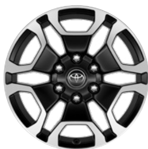
18" fekete, csiszolt felületű könnyűfém keréktárcsa (6 küllős) Alapfelszereltség az Executive modellváltozaton