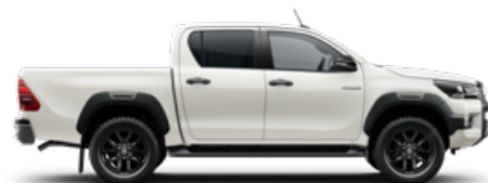
089 Gyöngyfehér* Metálfényezés nettó 310 000 Ft bruttó 393 700 Ft