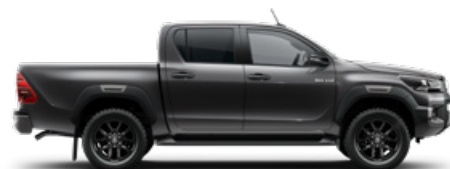
1G3 Hamuszürke Metálfényezés nettó 255 000 Ft bruttó 323 850 Ft