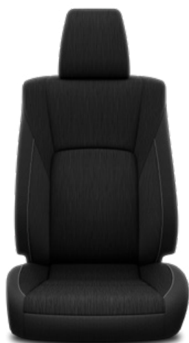
Függőleges mintázatú fekete szövet Alapfelszereltség az Active és Executive modellváltozaton