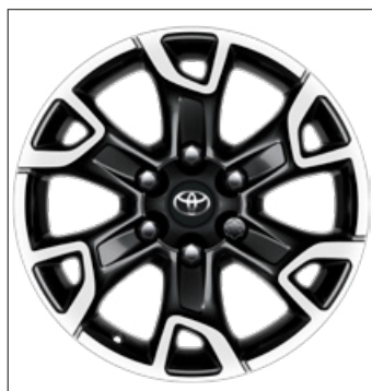
18" fekete, csiszolt hatású könnyűfém keréktárcsák 439 600 Ft