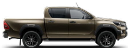
6X1 Barnászöld Metálfényezés nettó 255 000 Ft bruttó 323 850 Ft