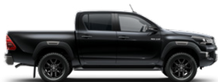
218 Fekete gyöngyház Metálfényezés nettó 255 000 Ft bruttó 323 850 Ft