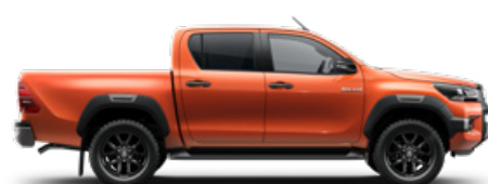
4R8 Narancsmetál Metálfényezés nettó 255 000 Ft bruttó 323 850 Ft