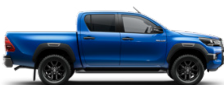
8X2 Vízkék Metálfényezés nettó 255 000 Ft bruttó 323 850 Ft