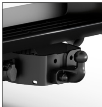
Peremre rögzített vonóhorog Vonóhorog szett 7 pólusú kábellel 293 000 Ft (márkakereskedői szerelés)