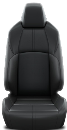
Fekete bőr ülésborítás Alapfelszereltség az Executive felszereltségnél