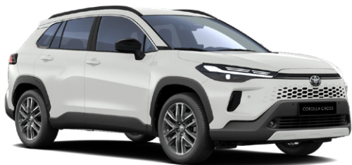
040 Hófehér felár nélkül Elérhető a Comfort és Style felszereltségeknél