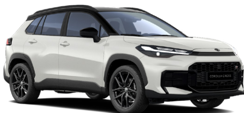
2VP Platina gyöngy GR Sport modell listaára tartalmazza