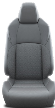
Szürke szövet ülésborítás Alapfelszereltség a Comfort, Style felszereltségnél