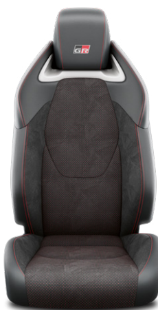
Szintetikus bőr és szövet kombinált GR Sport ülésborítás, piros varrással Alapfelszereltség a GR Sport felszereltségnél