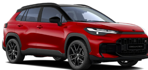
2TB Érzéki vörös GR Sport modell listaára tartalmazza