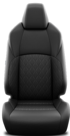
Fekete szövet ülésborítás Alapfelszereltség a Comfort, Style felszereltségnél