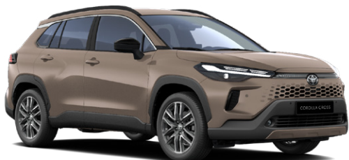
4Z2 "Föld barna" 270 000 Ft Elérhető a Comfort, Style és Executive felszereltségeknél