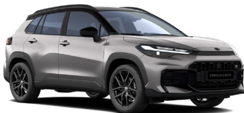
2NK Higanyezüst GR Sport modell listaára tartalmazza