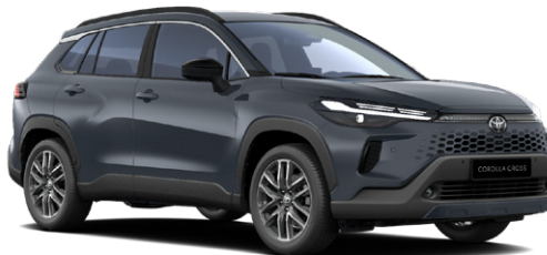
1L6 Sötétszürke 270 000 Ft Elérhető a Comfort, Style és Executive felszereltségeknél