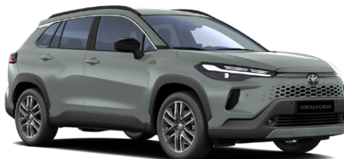
6X3 Oliva zöld* 270 000 Ft Elérhető a Comfort, Style és Executive felszereltségeknél