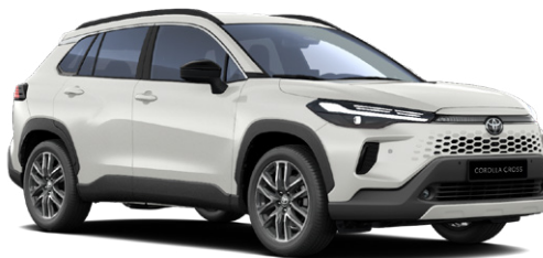
089 Platina gyöngyfehér** 350 000 Ft Elérhető a Comfort, Style és Executive felszereltségeknél