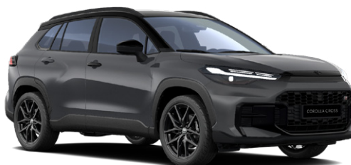
M29 Viharszürke GR Sport modell listaára tartalmazza