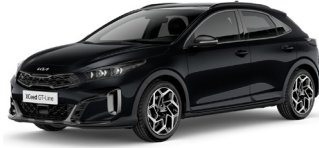
Black Pearl (1K)