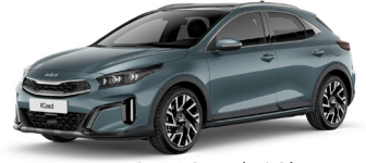
Yuca Steel Gray (USG) GT-Linehoz nem elérhető