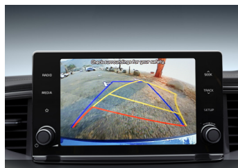
Multimédia egység 8" tolatókamerával