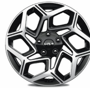
18" könnyűfém keréktárcsa (GT-LINE)