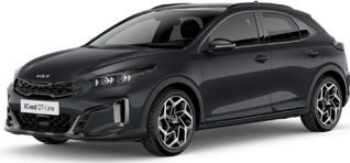
Penta Metal (H8G)