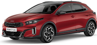
Infra Red (AA9)