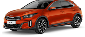
Orange Fusion (RNG) GT-Linehoz nem elérhető