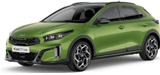
Celadon Spirit Green (CE6)