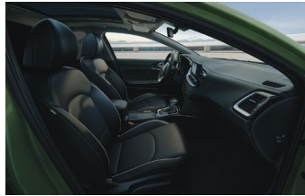
Opcionális BŐR csomag bőr kárpitozással X-PLATINUM felszereltséghez