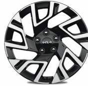
18" könnyűfém keréktárcsa (X-GOLD, X-PLATINUM)