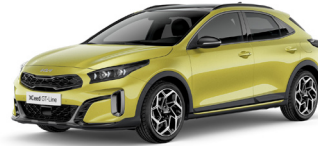
Splash Lemon (G2Y)