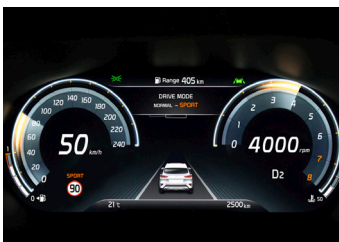
Supervision műszeregység 12.3"