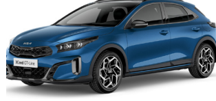
Blue Flame (B3L)