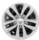
Acél keréktárcsa 15" SILVER, FUSION