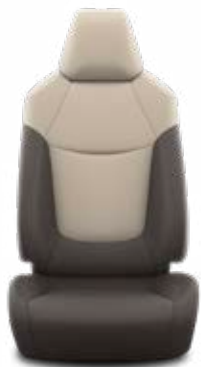
Sötétbarna szövet ülésborítás bézs betétekkel

Alapfelszereltség az Active felszereltségnél