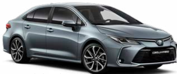
1K3 Szürkékék metál*