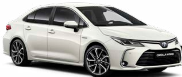
070 Gyöngyfehér §