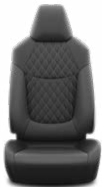
Fekete szövet ülésborítás bőr részekkel és steppelt betétekkel, bézs varrással

Alapfelszereltség az Executive és Hybrid Executive felszereltségnél