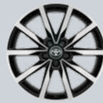
18" fekete színű könnyűfém keréktárcsák (5 duplaküllős) Opció az Executive felszereltséghez