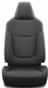
Fekete szövet ülésborítás

Alapfelszereltség az Active felszereltségnél