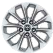
16" könnyűfém keréktárcsák (10 küllős) Alapfelszereltség a Hybrid Active, Comfort és Hybrid Comfort felszereltségnél