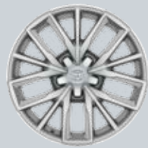
17" ezüst színű könnyűfém keréktárcsák Opció a Comfort felszereltséghez