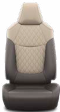
Sötétbarna szövet ülésborítás bőr részekkel és steppelt bézs betétekkel, bézs varrással

Alapfelszereltség az Active felszereltségnél