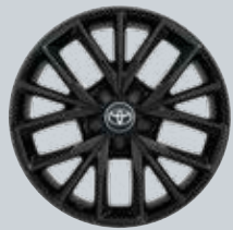
17" fekete színű könnyűfém keréktárcsák Opció a Comfort felszereltséghez