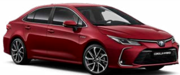
3T3 Burgundi vörös §