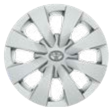
15" acél keréktárcsák dísz tárcsával (8 küllős) Alapfelszereltség az Active felszereltségnél