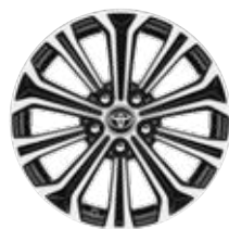
17" kéttónusú fekete, csiszolt hatású könnyűfém keréktárcsák (10 küllős) Alapfelszereltség a Comfort Style, Hybrid Comfort Style, Executive és Hybrid Executive felszereltségnél