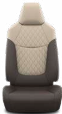
Sötétbarna szövet ülésborítás steppelt bézs betétekkel

Alapfelszereltség az Executive és Hybrid Executive felszereltségnél