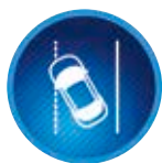
Sávelhagyásra figyelmeztető rendszer kormányrásegítéssel (LDA)

Egy lézeres rendszer kamerák segítségével ellenőrzi, hogy a jármű előtti útszakaszon található-e más jármű. Amennyiben a rendszer egy ütközés kockázatát észleli, látható és hallható eszközökkel figyelmezteti a vezetőt, és egyben felkészíti a fékeket is a beavatkozásra.