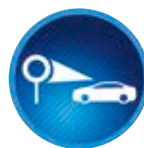
Jelzőtábla felismerő rendszer (TSR)

Egy kamera közreműködésével a rendszer figyelni a forgalmi sávokat elválasztó vonalakat, és audiovizuális jelekkel figyelmezteti a vezetőt, ha azt észleli, hogy a jármű az irányjelző működtetése nélkül készül elhagyni a sávot.