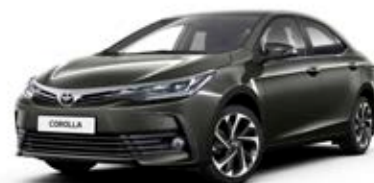
1G2 Platinum bronz*