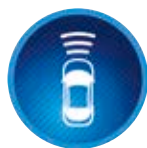
Ütközés előtti rendszer (PCS)

Egy lézeres rendszer kamerák segítségével ellenőrzi, hogy a jármű előtti útszakaszon található-e más jármű. Amennyiben a rendszer egy ütközés kockázatát észleli, látható és hallható eszközökkel figyelmezteti a vezetőt, és egyben felkészíti a fékeket is a beavatkozásra.