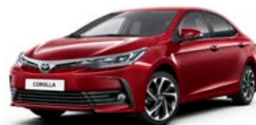
3T3 Burgundi vörös*