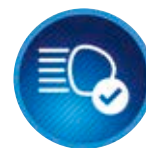
Automatikus távolságifény-vezérlés (AHB)

A rendszer felismeri a kihelyezett jelzőtáblákat, és megjeleníti jól láthatóan az új, színes TFT kijelzőn. A rendszer hallható és látható módon hívja fel a figyelmet, ha nem tesz eleget a jelzőtábla utasításainak.