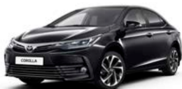
209 Éjfékete* Felár nélkül