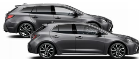
1G3 Szürke metál* 270 000 Ft Elérhető az Active, Comfort és Executive felszereltségeknél