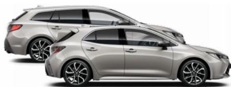
1J6 Krómezüst o 350 000 Ft Elérhető az Active, Comfort és Executive felszereltségeknél