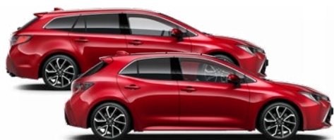
3U5 Érzéki vörös* 350 000 Ft Elérhető az Active, Comfort és Executive felszereltségeknél