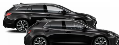
209 Éjfekete* 270 000 Ft Elérhető az Active, Comfort és Executive felszereltségeknél