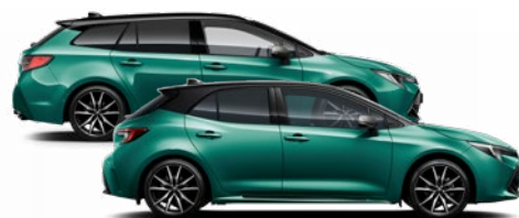
M28 Racing green / Fekete tető Elérhető a GR SPORT felszereltségen