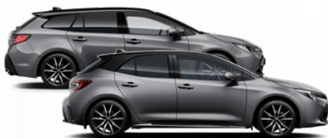
2MB GR SPORT Szürke metál / Fekete tető Elérhető a GR SPORT felszereltségen