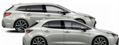
1K6 Nikkelszürke 350 000 Ft Elérhető az Active, Comfort és Executive felszereltségeknél