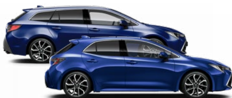
8Y8 Boróka metál* 270 000 Ft Elérhető az Active, Comfort és Executive felszereltségeknél