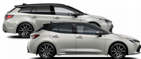
2RZ GR SPORT Nikkelszürke / Fekete tető Elérhető a GR SPORT felszereltségen