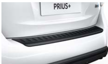
Hátsó lökhárító védőlemez