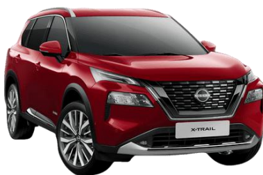
Sötétvörös NBL – 250 000 Ft