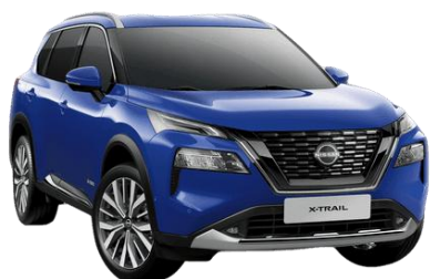
Kék RBV – 210 000 Ft