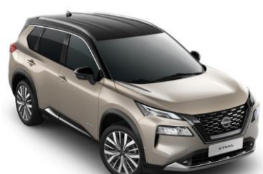
Pezsgő ezüst - Fekete XEW – 450 000 Ft