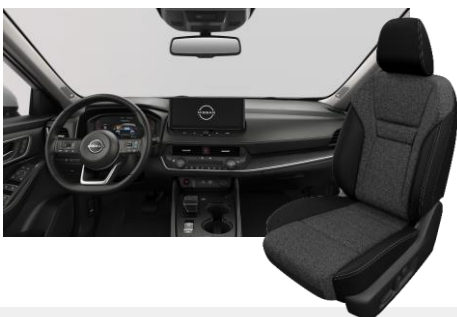
FEKETE SZÖVET ÜLÉSEK [G]