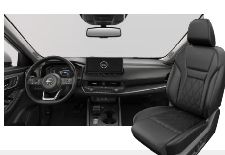
FEKETE NAPPABŐR ÜLÉSEK [G]