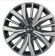
20"-OS KÖNNYŰFÉM KERÉKTÁRCSÁK (Opció)