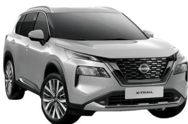
Ezüst K23 – 210 000 Ft