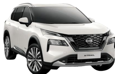
Gyöngyházfehér QBE – 250 000 Ft