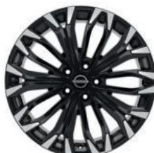
19"-OS KÖNNYŰFÉM KERÉKTÁRCSÁK