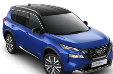
Kék - Fekete XEU – 410 000 Ft