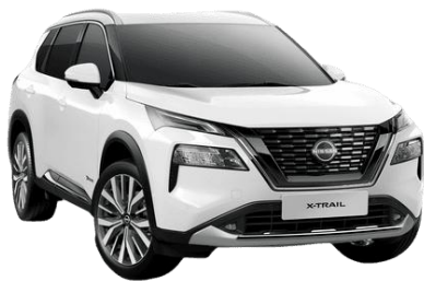
Alap fehér QAK