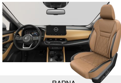
BARNA NAPPABŐR ÜLÉSEK [C]