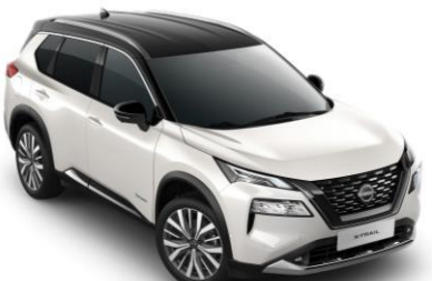
Gyöngyházfehér - Fekete XKJ – 450 000 Ft