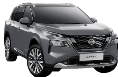
Gyöngyházzsürke KBY – 250 000 Ft