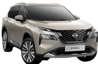
Pezsgő ezüst KAY – 250 000 Ft