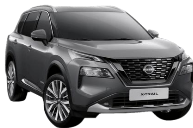
Szürke KAD – 210 000 Ft