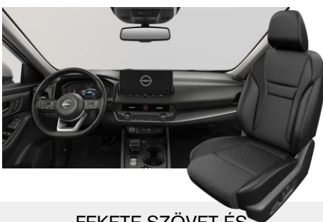
FEKETE SZÖVET ÉS SZINTETIKUS BŐRÜLÉSEK [G]