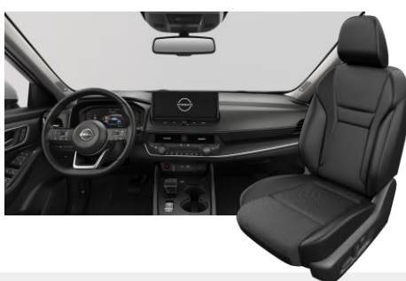
FEKETE SZÖVET ÉS SZINTETIKUS BŐRÜLÉSEK [G]