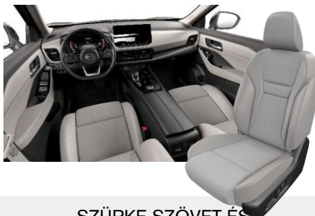
SZÜRKE SZÖVET ÉS SZINTETIKUS BŐRÜLÉSEK [K]