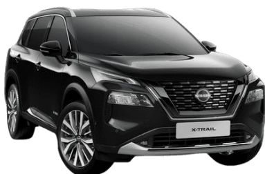
Fekete G41 – 210 000 Ft