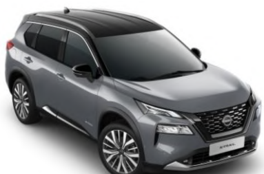
Gyöngyházzsürke - Fekete XEX – 450 000 Ft