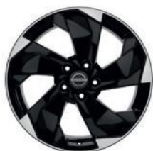
18"-OS KÖNNYŰFÉM KERÉKTÁRCSÁK