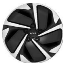
17" könnyűfém keréktárcsa Type B /VB/ (GOLD - ICE/HEV)