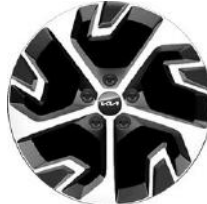
18" könnyűfém keréktárcsa Type A /XK/ (PLATINUM - ICE/HEV)