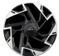
19" könnyűfém keréktárcsa Type A /XM/ (GT-LINE - ICE/PHEV)