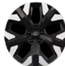
19" könnyűfém keréktárcsa Type B /XP/ (GOLD, PLATINUM - PHEV)