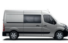
Furgon - duplakabin