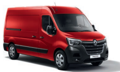
Furgon - hátsókerék-hajtás