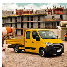
Plató - duplakabin