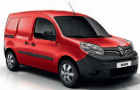
Élénk piros (719)