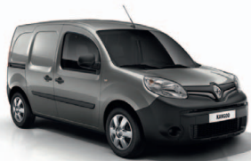
Éjféli szürke (KPW)