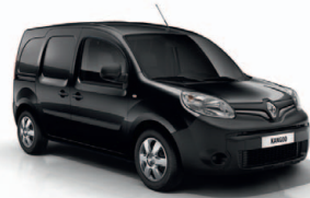
Fekete metál (GND)*