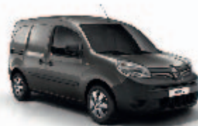
Kassziopéa szürke (KNG)*