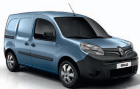
Üstökös kék (RNL)*