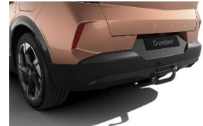
Szerszám nélkül leszerelhető vonóhorog 13 pólusú csatlakozóval