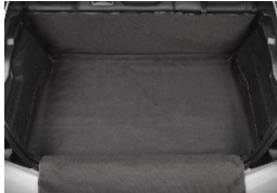
Csomagtartó burkolat (vinil lőkhárító védelemmel)