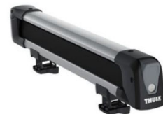
Snowpack 7324 tartó: 4 db síléc / 2 db snowboard