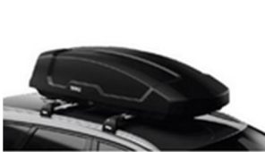
Freeride 532 1-db-os kerékpártartó