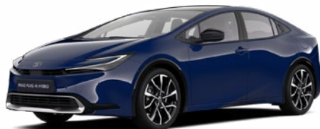
8Q4 Sötétkék felár nélkül