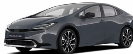
1M2 Hamu szürke* 300 000 Ft