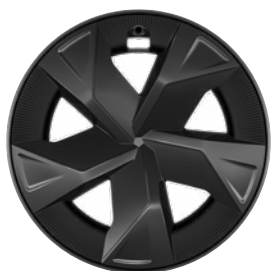
17" sötétszürke könnyűfém keréktárcsák aerodinamikai terelővel 195/60 R17 gumiabroncs Széria a Comfort szereltségnél