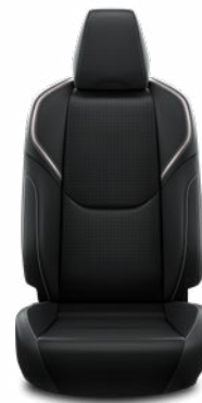
Fekete mesterséges bőr ülésborítás Széria az Executive szereltségben