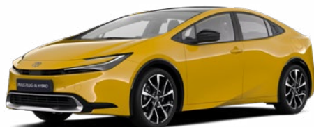
5C5 Mustársárga metál* 200 000 Ft