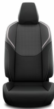
Fekete szövet ülésborítás Széria a Comfort és Prestige szereltségekben