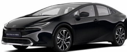
218 Fekete metál* 200 000 Ft