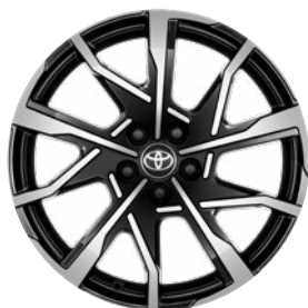
19" csiszolt hatású fekete könnyűfém keréktárcsák 195/50 R19 gumiabroncsokkal Széria a Prestige és Executive szereltségben