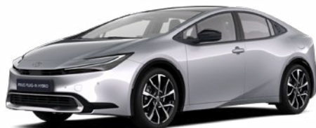
1L0 Palladium ezüst* 200 000 Ft