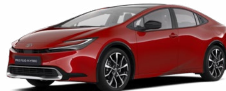
3U5 Érzéki Vörös 300 000 Ft