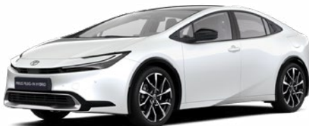
089 Gyöngy fehér 300 000 Ft