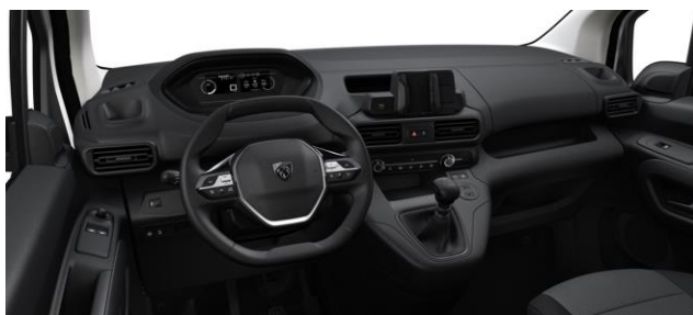
Vezetőhely (alap konfiguráció)