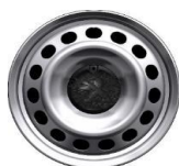
Felni közép "DEMI STYLE" 16"