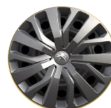
Dísz tárcsa - TONGARIRO 16**