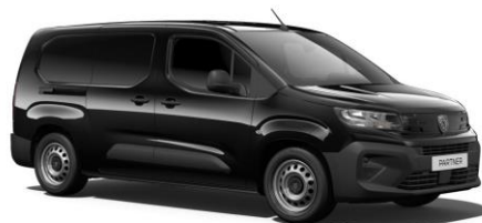
PERLA NERA fekete