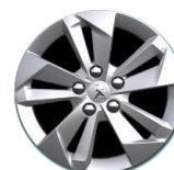
Alumínium keréktárcsa - TARANAKI 16"