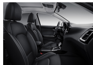
Opcionális BŐR csomag PLATINUM felszereltséghez