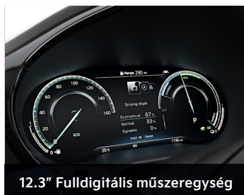
12.3" Fulldigitális műszeregység