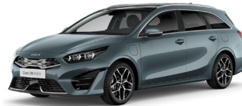
Yucca Steel Grey (USG)