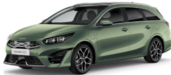
Expérience Green (EXG)