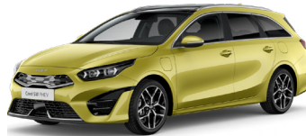
Splash Lemon (G2Y)