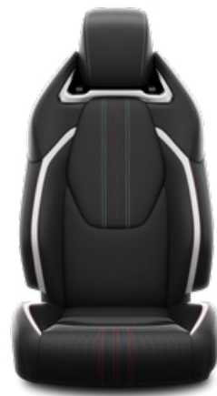
Sötétszürke szövet és szintetikus bőr ülésborítás GR SPORT logoval Alapfelszereltség a GR SPORT és GR SPORT Dynamic felszereltségnél