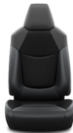
Fekete szövet ülésborítás bőr részekkel és steppelt betétekkel, bézs varrással Alapfelszereltség Hybrid Executive felszereltségnél