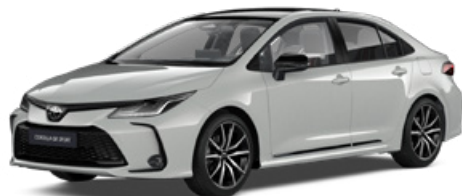
2VF GR-S hamuszürke felár nélkül – GR SPORT