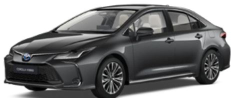
1G3 Szürke metál 200 000 Ft