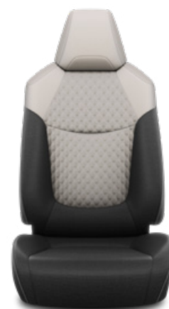
Szürke szövet ülésborítás steppelt világosszürke betétekkel Alapfelszereltség a Comfort, Comfort Tech és Comfort Style Tech felszereltségnél