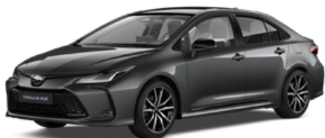
2NB GR-S szürke metál felár nélkül – GR SPORT