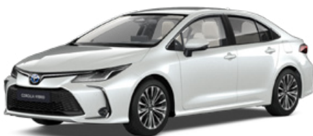
089 Platina gyöngyfehér** 300 000 Ft