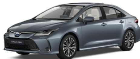
1K3 Szürkéskék metál* 200 000 Ft