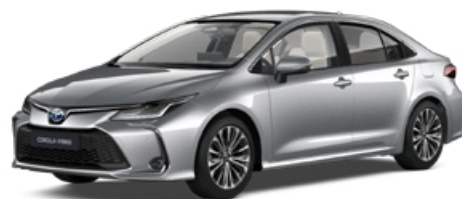
1L0 Palladium ezüst* 200 000 Ft