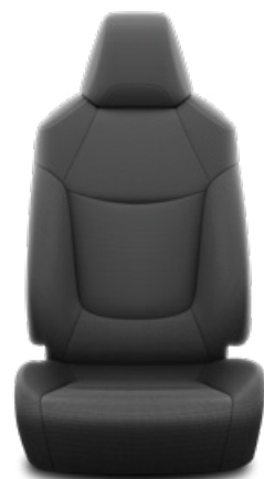
Fekete szövet ülésborítás Alapfelszereltség az Active felszereltségnél