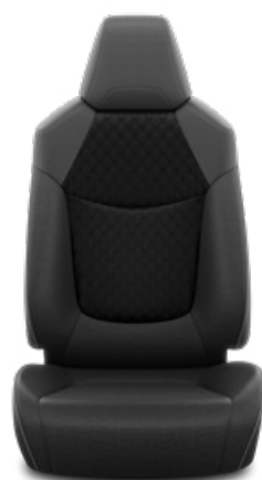
Fekete szövet ülésborítás steppelt fekete betétekkel Alapfelszereltség a Comfort, Comfort Tech és Comfort Style Tech felszereltségnél