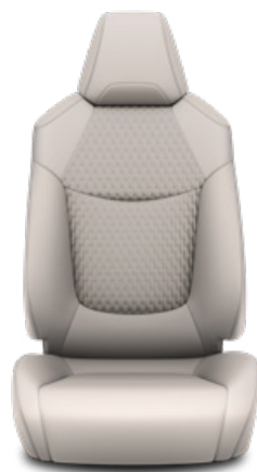
Világosszürke szövet ülésborítás bőr részekkel és steppelt szürke betétekkel, szürke varrással Alapfelszereltség Hybrid Executive felszereltségnél