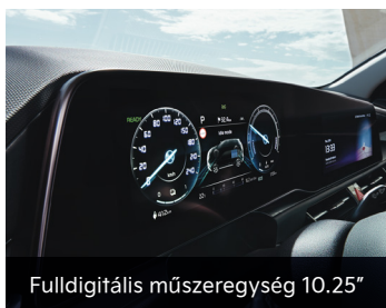
Fulldigitális műszeregység 10.25"