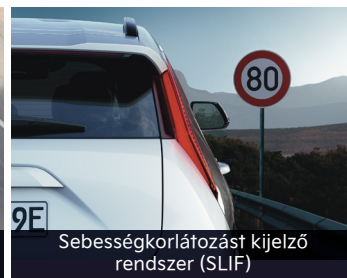
Sebességkorlátozást kijelző rendszer (SLIF)