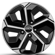
16" alumínium keréktárcsa