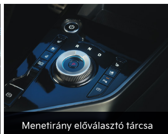
Menetirány előválasztó tárcsa