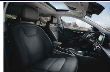
KRYPTONITE fekete szintetikus bőr kárpit (sztfender választható)