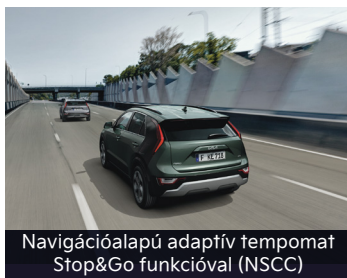
Navigációalapú adaptív tempomat Stop&Go funkcióval (NSCC)