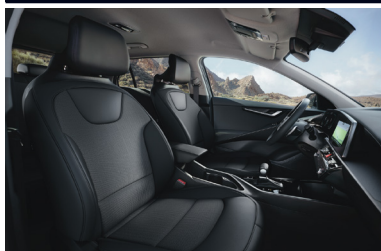
ESSENCE/ SILVER fekete szövet kárpit (sztfender)