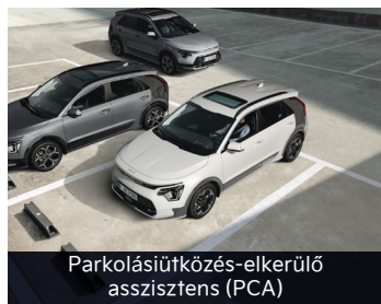
Parkolásiútközés-elkerülő asszisztens (PCA)