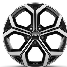
18" alumínium keréktárcsa