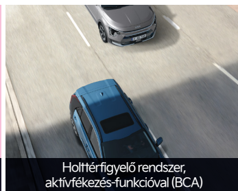
Holtterfigyelő rendszer, aktívfékezés-funkcióval (BCA)