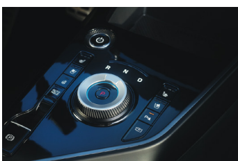
Menetirány előválasztó tárcsa