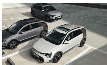
Parkolásiütközés-elkerülő asszisztens (PCA)