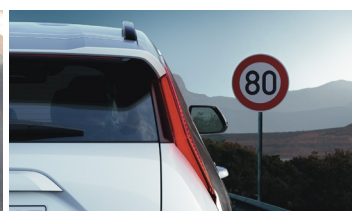
Sebességhorlátozást kijelző rendszer (SLIF)