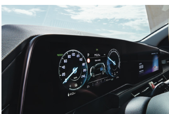
Fulldigitális műszeregység 10.25"