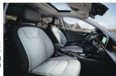
KRYPTONITE szürke vegánbőr kárpit (sztenderd választható)