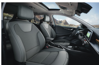
GOLD / PLATINUM szürke műbőr-szövetkárpit (opciós)