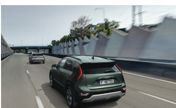
Navigációalapú adaptív tempomat Stop&Go funkcióval (NSCC)