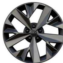
18" könnyűfém keréktárcsa Type B /XL/ (GT-LINE - HEV)