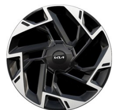
19" könnyűfém keréktárcsa Type A /XM/ (GT-LINE - ICE/PHEV)