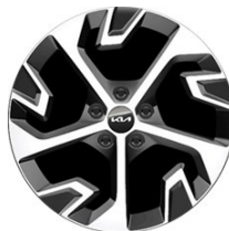
18" könnyűfém keréktárcsa Type A /XK/ (PLATINUM - ICE/HEV)