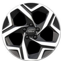
17" könnyűfém keréktárcsa Type A /VA/ (SILVER)