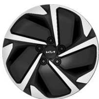
17" könnyűfém keréktárcsa Type B /VB/ (GOLD - ICE/HEV)