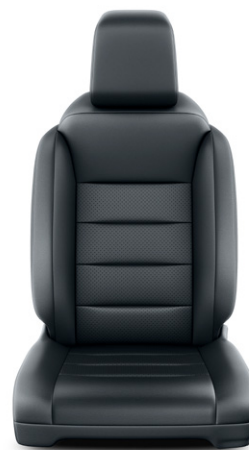
Fekete bőr Alapfelszereltség VIP modelleken