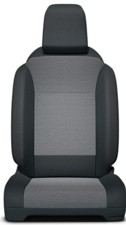
Fekete szövet barna betétekkel Alapfelszereltség Family modelleken