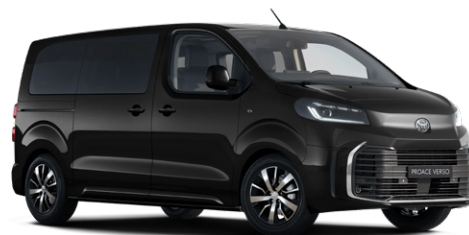
KTV Éjfékete Metálfényezés Bruttó 280 000 Ft