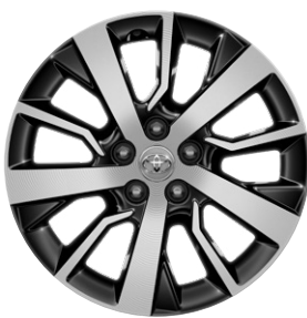
17" könnyűfém keréktárcsák