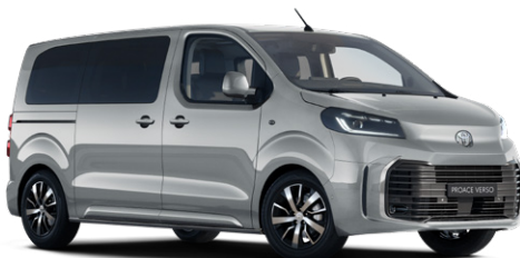
KCA Ezüst Metálfényezés Bruttó 280 000 Ft