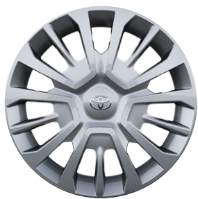
16"/17" acél keréktárcsák dísz tárcsával