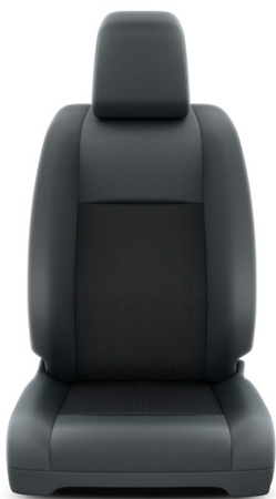
Fekete szövet ülésborítás Alapfelszereltség Combi és Business modelleken