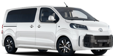
EPR Hófehér felár nélkül