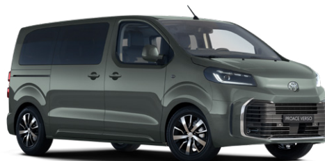
EDU Terepzöld Metálfényezés Bruttó 280 000 Ft

A karosszéria színe a felszereltségi szinttől is függhet.