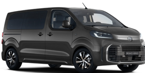
KKJ Titánszürke Metálfényezés Bruttó 280 000 Ft