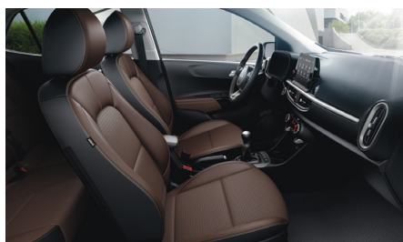
BROWN opciós (PLATINUM felszereléshez) szintetikus bőr kárpit