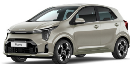
Milky Beige (M9Y) Prémium Metál