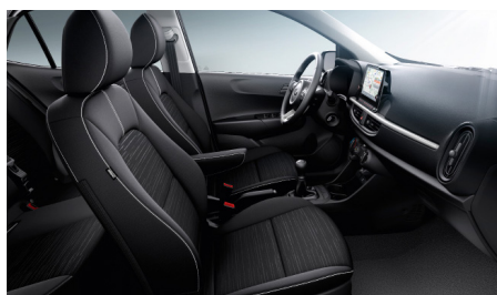
GOLD / PLATINUM sztenderd fekete szövet kárpit