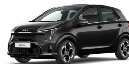
Aurora Black Pearl (ABP) Metál