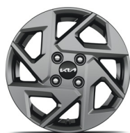
GOLD PLUS (opciós) 14" könnyűfém keréktárcsa