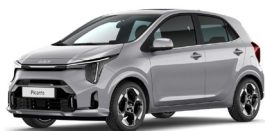
Sparkling Silver (KCS) Metál