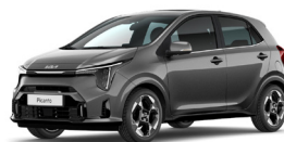
Astro Grey (M7G) Metál