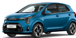
Sporty Blue (SPB) Prémium Metál