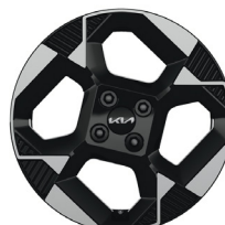
PLATINUM 16" könnyűfém keréktárcsa