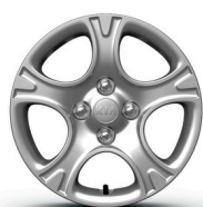
GOLD 14" acél keréktárcsa díszláncával