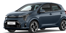
Smoke Blue (EU3) Prémium Metál