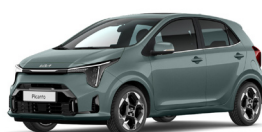
Adventurous Green (A2G) Prémium Metál