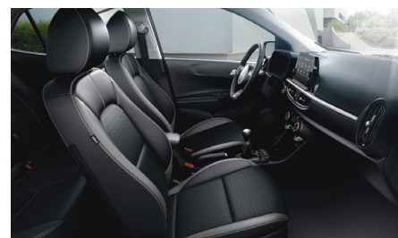
GT LINE sztenderd fekete szintetikus bőr kárpit