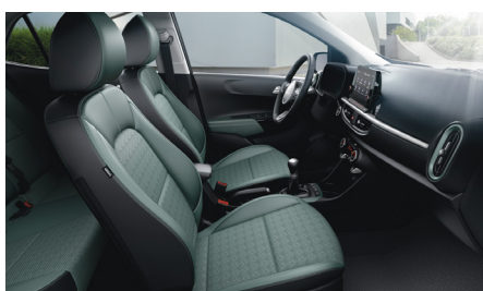
ADVENTUROUS GREEN opciós (GT-LINE felszereléshez) szintetikus bőr kárpit