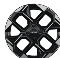
GT LINE 16" könnyűfém keréktárcsa