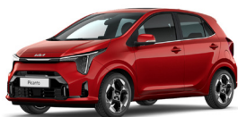
Signal Red (BEG) Prémium Metál