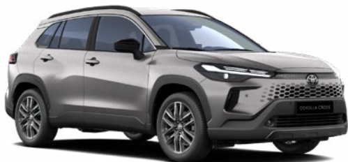
1K0 Higanyezüst 270 000 Ft Elérhető a Comfort, Style és Executive felszereltségeknél