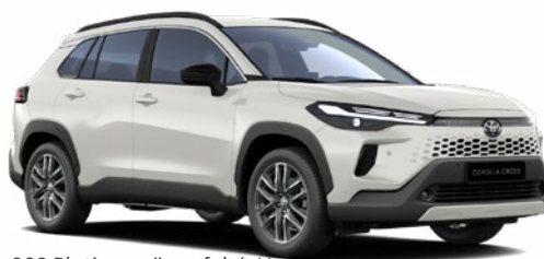
089 Platina gyöngyfehér** 350 000 Ft Elérhető a Comfort, Style és Executive felszereltségeknél