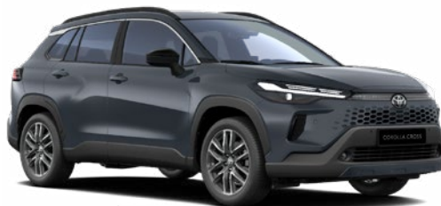
1L6 Sötétszürke 270 000 Ft Elérhető a Comfort, Style és Executive felszereltségeknél