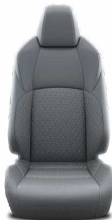
Szürke szövet ülésborítás Alapfelszereltség a Comfort, Style felszereltségnél