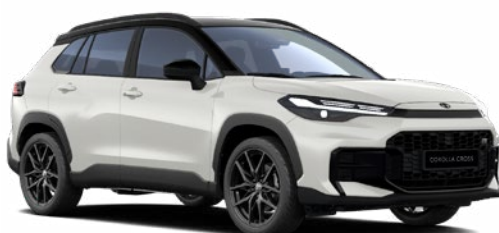
2VP Platina gyöngyfehér GR Sport modell listaára tartalmazza