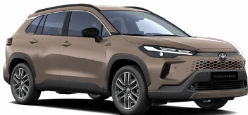
4Z2 Föld barna 270 000 Ft Elérhető a Comfort, Style és Executive felszereltségeknél