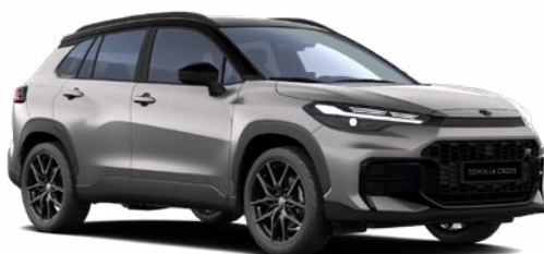
2NK Higanyezüst GR Sport modell listaára tartalmazza