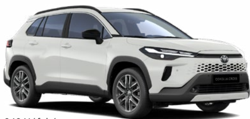
040 Hófehér felár nélkül Elérhető a Comfort és Style felszereltségeknél