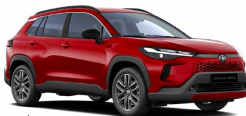
3U5 Érzéki vörös 350 000 Ft Elérhető a Style és Executive felszereltségeknél