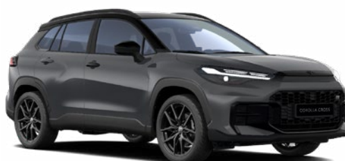
M29 Viharszürke GR Sport modell listaára tartalmazza