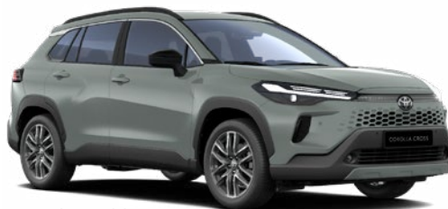
6X3 Olíva zöld* 270 000 Ft Elérhető a Comfort, Style és Executive felszereltségeknél