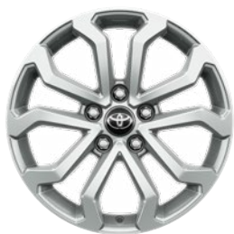
17" könnyűfém keréktárcsák 215/60 R17 gumiabroncsok Alapfelszereltség: Comfort