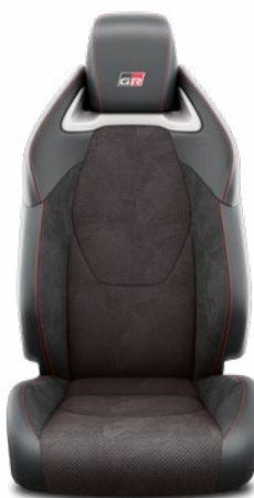
Szintetikus bőr és szövet kombinált GR Sport ülésborítás, piros varrással Alapfelszereltség a GR Sport felszereltségnél