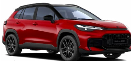
2TB Érzéki vörös GR Sport modell listaára tartalmazza