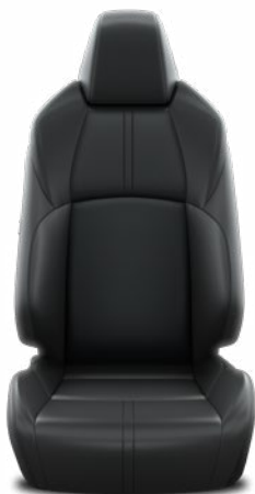
Fekete bőr ülésborítás Alapfelszereltség az Executive felszereltségnél