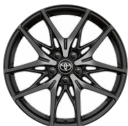
19" könnyűfém keréktárcsák 225/45 R19 gumiabroncsok Alapfelszereltség: GR Sport felszereltség