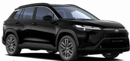
209 Éjfékete 270 000 Ft Elérhető a Comfort, Style és Executive felszereltségeknél