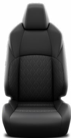
Fekete szövet ülésborítás Alapfelszereltség a Comfort, Style felszereltségnél