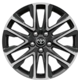
18" könnyűfém keréktárcsák 225/50 R18 gumiabroncsok Alapfelszereltség: Style és Executive