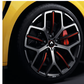
19" Akio könnyűfém tárcsa