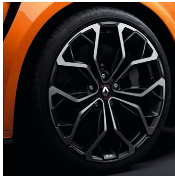
19" Interlagos ezüst-fekete könnyűfém tárcsa