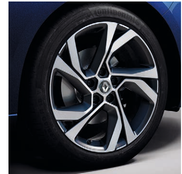
18" Diamond Dynamic könnyűfém tárcsa