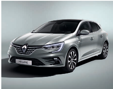
Balti szürke (2)