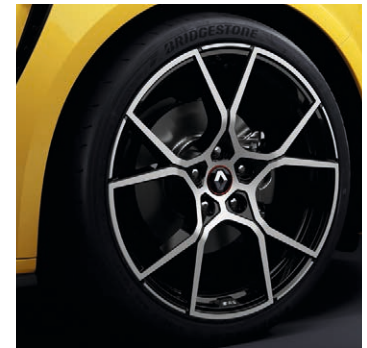
19" Fuji könnyűfém tárcsa