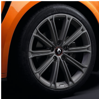
18" Estoril könnyűfém tárcsa