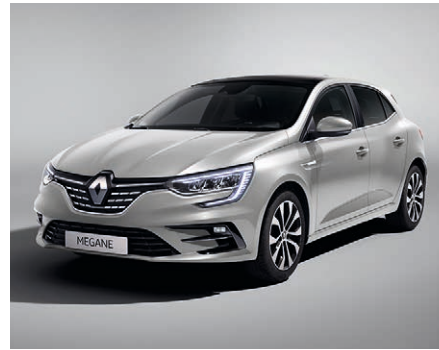
Highland szürke (2)