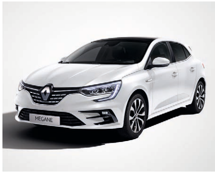
Gyöngyház fehér (2)