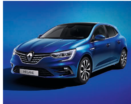
Ferrit kék (2)