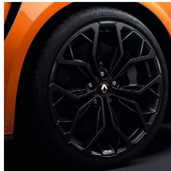
19" Interlagos fényes fekete könnyűfém tárcsa