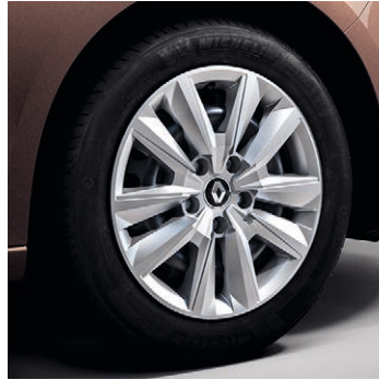
16" acélfelni Eclipse dísz tárcsával