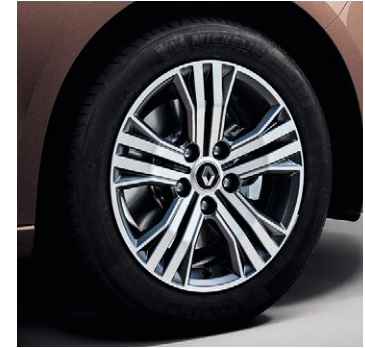
16" Diamond Impulse könnyűfém tárcsa