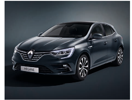
Titánium szürke (2)