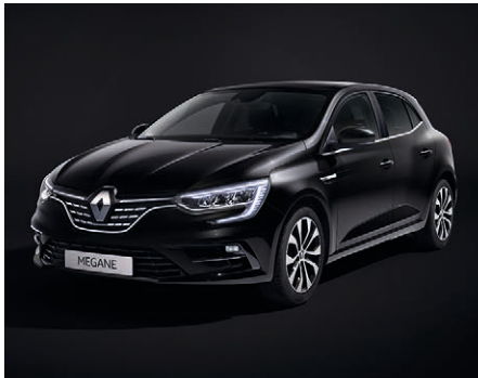
Fekete gyémánt (2)