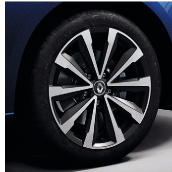
17" Diamond Passion könnyűfém tárcsa