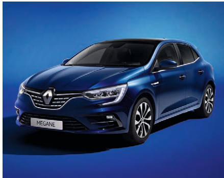
Kozmosz kék (2)