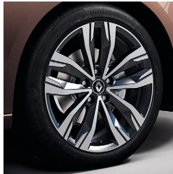
18" Diamond Hightech könnyűfém tárcsa