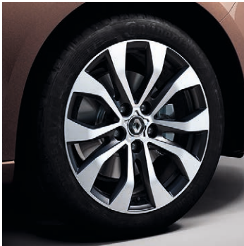
17" Diamond Emotion könnyűfém tárcsa