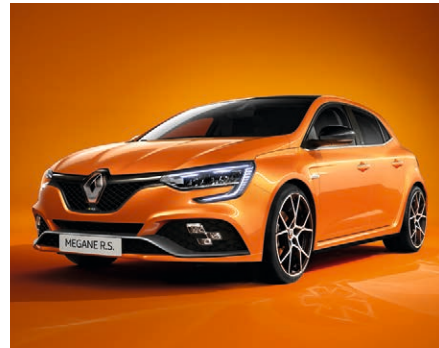
Pezsgő narancs (3)