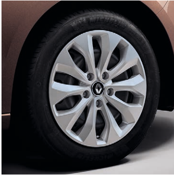
16" acélfelni Florida dísz tárcsával