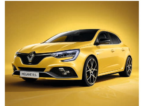
Sirius sárga (3)

(1) Nem metál fényezés. (2) Metálfényezés. (3) Speciális R.S. metálfényezés. A valós színek eltérhetnek a fotóképtől.