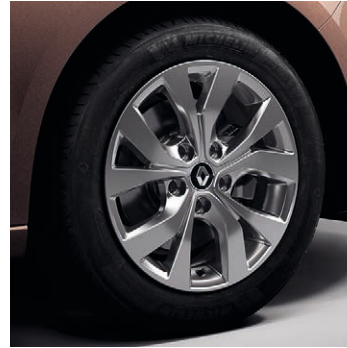
16" Celsius könnyűfém tárcsa