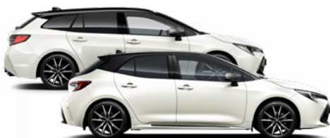
2PU GR SPORT Platina fehér / Fekete tető Elérhető a GR SPORT felszereltségen