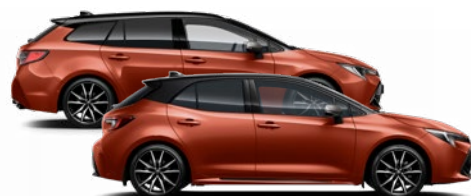
M42 GR SPORT Láva vörös / Fekete tető Elérhető a GR SPORT felszereltségen