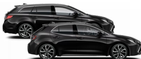
209 Éjfékete* 270 000 Ft Elérhető az Active, Comfort, Style Style, Executive és GR Sport monotone felszereltségeknél