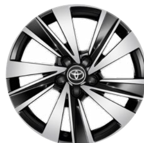
17" könnyűfém keréktárcsák 225/45 R17 gumiabronccsal Alapfelszereltség: Style