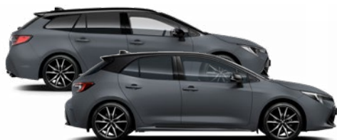
1M1 Selyemszürke (GR Sport) 600 000 Ft Elérhető a GR Sport monotone felszereltségen