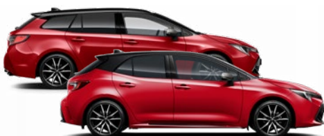
2SZ GR SPORT Érzéki vörös / Fekete tető Elérhető a GR SPORT felszereltségen