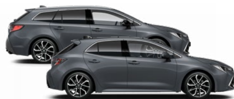
1M2 Viharszürke 270 000 Ft Elérhető az Active, Comfort, Style és Executive felszereltségeknél