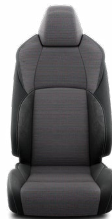
Fekete szövet ülésborítás steppelt fekete betétekkel Alapfelszereltség a Style felszereltségnél