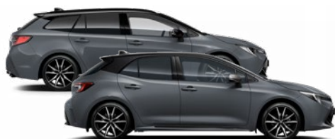
M52 Viharszürke fekete tetővel (1M2) Elérhető a GR SPORT felszereltségen