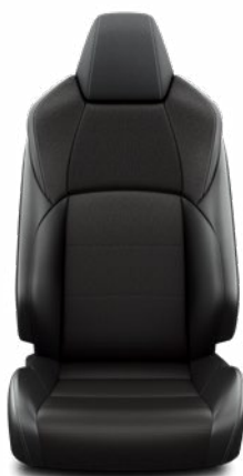
Fekete szövet ülésborítás steppelt fekete betétekkel Alapfelszereltség a Comfort és Comfort Tech felszereltségnél