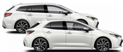
040 Hófehér felár nélkül Elérhető az Active, Comfort, Style és Executive felszereltségeknél