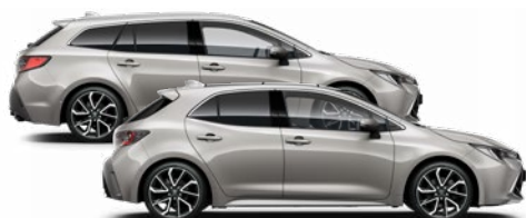
1J6 Krómezüst o 350 000 Ft Elérhető az Active, Comfort, Style és Executive felszereltségeknél