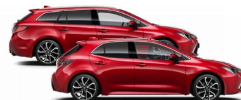
3U5 Érzéki vörös* 350 000 Ft Elérhető az Active, Comfort, Style és Executive felszereltségeknél