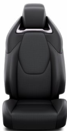
Fekete szövet ülésborítás bőr részekkel és steppelt betétekkel, bézs varrással Alapfelszereltség az Executive felszereltségnél