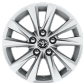
16" könnyűfém keréktárcsák 205/55 R16 gumiabronccsal Alapfelszereltség: Comfort és Comfort + Tech