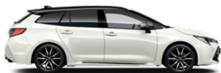
2PU GR SPORT Platina fehér/Fekete tető Elérhető a GR SPORT felszereltségen