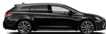
209 Éjfekete* 200 000 Ft