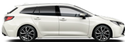
089 Platina gyöngy 300 000 Ft