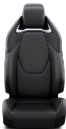
Bőr ülésborítás, fekete Alapfelszereltség az Executive felszereltségnél