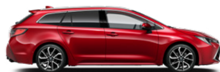
3U5 Érzéki vörös* 300 000 Ft