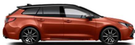
M42 GR SPORT Láva vörös/Fekete tető Elérhető a GR SPORT felszereltségen