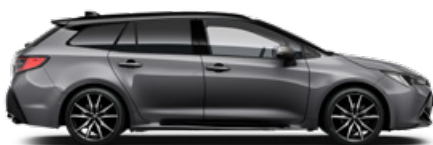
2MB GR SPORT Szürke metál/Fekete tető Elérhető a GR SPORT felszereltségen