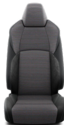
Fekete szövet ülésborítás steppelt fekete betétekkel Alapfelszereltség a Comfort Style Tech felszereltségnél