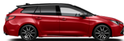
2SZ GR SPORT Passion/Fekete tető Elérhető a GR SPORT felszereltségen