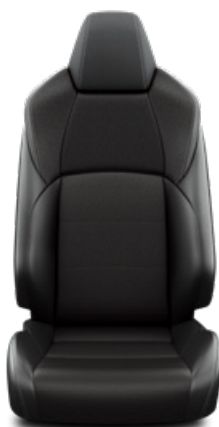
Fekete szövet ülésborítás steppelt fekete betétekkel Alapfelszereltség a Comfort és Comfort Tech felszereltségnél