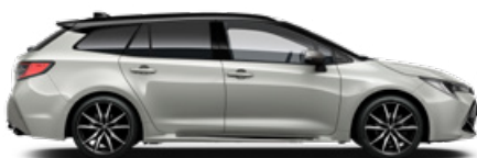
2RZ GR SPORT Higanyszürke/Fekete tető Elérhető a GR SPORT felszereltségen