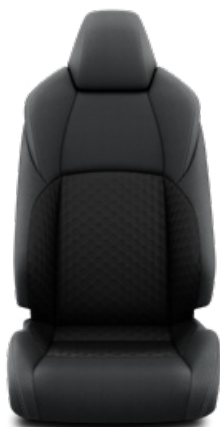
Fekete szövet ülésborítás Alapfelszereltség az Active felszereltségnél