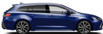
8Y8 Boróka metál* 200 000 Ft