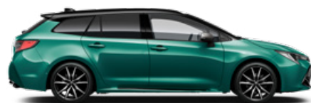
M28 Racing green/Fekete tető különleges fényezés Elérhető a GR SPORT felszereltségen