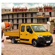
Plató - duplakabin