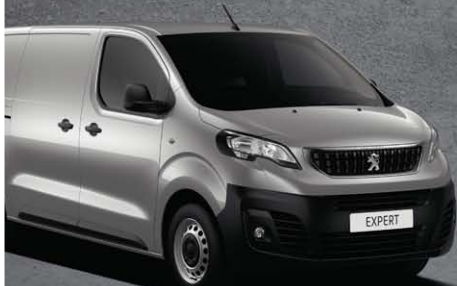
Szürke Aluminium (5)