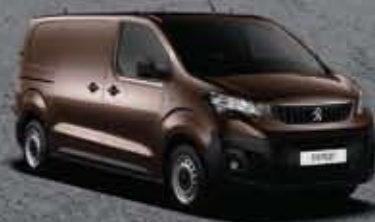
Barna Rich Oak (3)