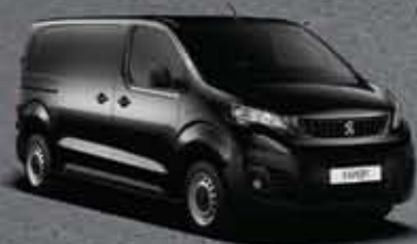
Fekete Onyx (1)