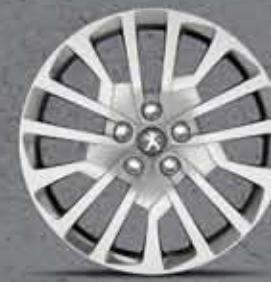
Miami 17" acél keréktárcsa (4)