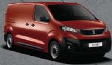
Narancssárga Tourmaline* (3)