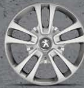
San Francisco 16" acél keréktárcsa (4)