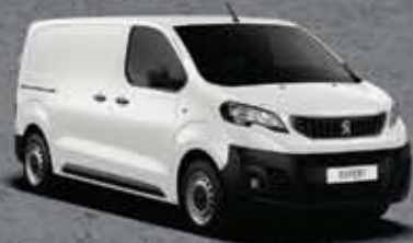
Fehér Banquise (2)