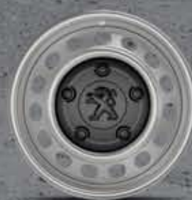
Fekete Cabochon 16" és 17" acél keréktárcsa (4)