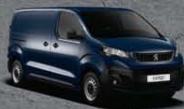
Kék Impérial (2)