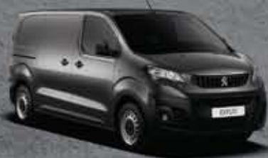
Szürke Platinium (3)