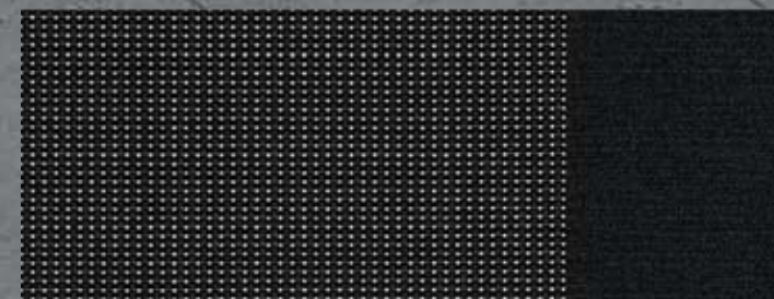
Curitiba Triton Meltem szövet (5)