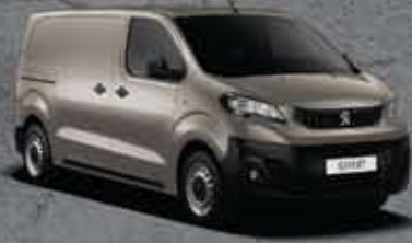
Szürke Silky (3)