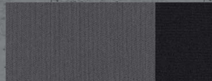
Curitiba monoton Bise szövet: Pro felszereltség esetén