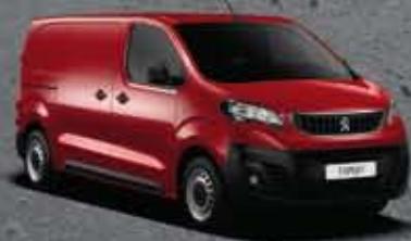
Piros Ardent (1)