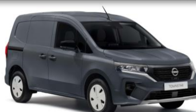
KPW Szürke (Nettó 70 000 HUF)

*- a megjelenített árak ÁFA nélkül értendők