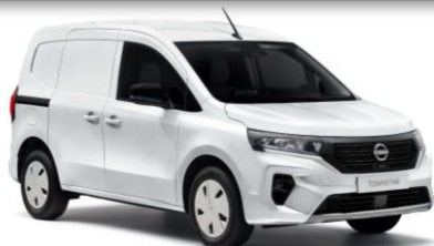
QNG Fehér (Felár nélkül)