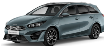
Yucca Steel Grey (USG)