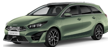
Exprecience Green (EXG)