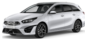
Deluxe White Pearl (HW2)