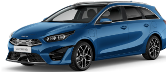
Blue Flame (B3L)