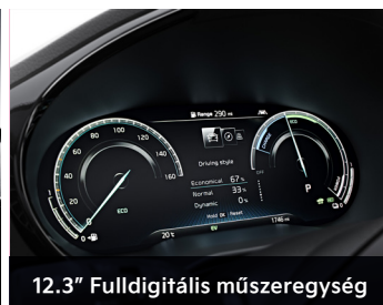
12.3" Fulldigitális műszeregység