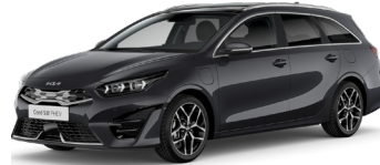
Penta Metal (H8G)