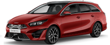
New Infra Red (AA9)