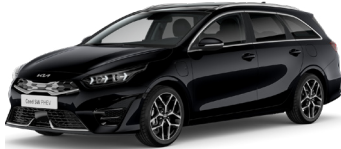
Black Pearl (1K)