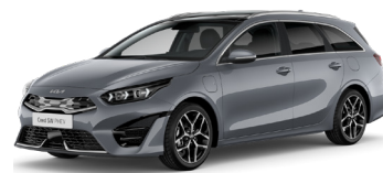
Lunar Silver (CSS)