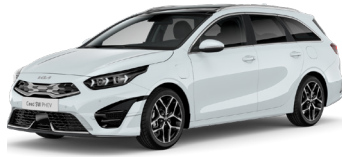
Cassa White (WD)