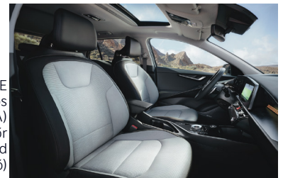
KRYPTONITE világos (színkód GRA) szintetikus bőr kárpit (sztenderd választható)