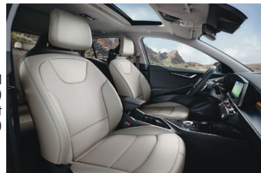
GOLD / PLATINUM világos (színkód GRA) szintetikus bőr - szövet kárpit (opcionális)