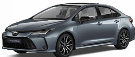
2TH GR-S szürkéskék felár nélkül – GR SPORT