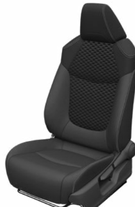
Fekete szövet ülésborítás bőr részekkel és steppelt betétekkel, bézs varrással Alapfelszereltség Hybrid Executive felszereltségnél