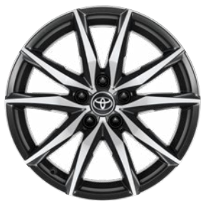
18" csiszolt hatású könnyűfém keréktárcsák (10 küllős) Alapfelszereltség a GR SPORT Dynamic felszereltségnél