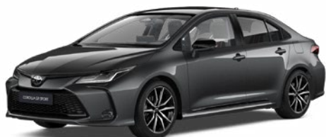
2NB GR-S szürke metál felár nélkül – GR SPORT