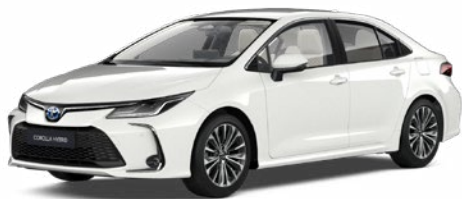
040 Hófehér felár nélkül