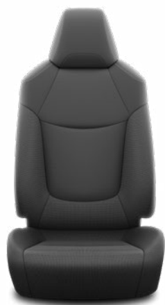
Fekete szövet ülésborítás Alapfelszereltség az Active felszereltségnél