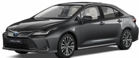
1G3 Szürke metál 200 000 Ft