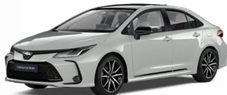
2VF GR-S hamuszürke felár nélkül – GR SPORT