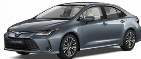
1K3 Szürkéskék metál* 200 000 Ft