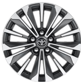
17" kéttónusú fekete, csiszolt hatású könnyűfém keréktárcsák Alapfelszereltség a Comfort Style, Hybrid Comfort Style felszereltségnél