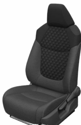
Fekete szövet ülésborítás steppelt fekete betétekkel Alapfelszereltség a Comfort, Comfort Tech és Comfort Style Tech felszereltségnél