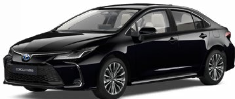
209 Éjfékete* 200 000 Ft