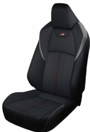
Sötétszürke szövet és szintetikus bőr ülésborítás GR SPORT logoval Alapfelszereltség a GR SPORT és GR SPORT Dynamic felszereltségnél