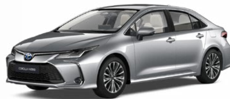
1L0 Palladium ezüst* 200 000 Ft