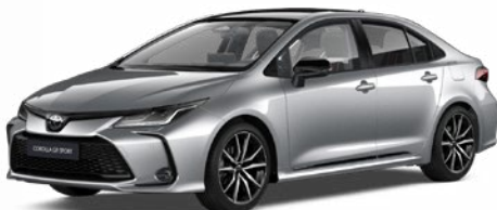
2VU GR-S prémium ezüst felár nélkül – GR SPORT