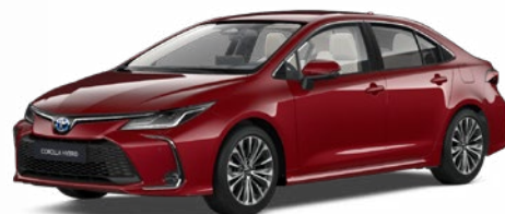
3U5 Érzéki vörös* 300 000 Ft