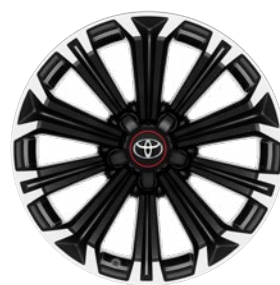
17" GR SPORT könnyűfém keréktárcsák (10 küllős) Alapfelszereltség a GR SPORT felszereltségnél