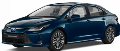
785 Tealevél mély zöld* 300 000 Ft