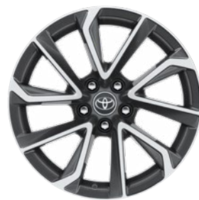
18" kéttónusú, szürke, csiszolt hatású könnyűfém keréktárcsák (5 dupla küllős) Executive Navi szereltségnél széria.