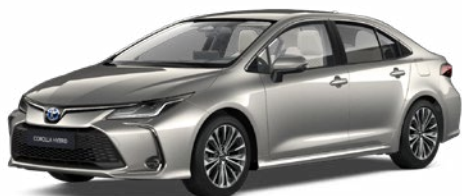
1J6 Krómezüst* 300 000 Ft