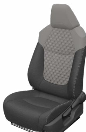
Szürke szövet ülésborítás steppelt világosszürke betétekkel Alapfelszereltség a Comfort, Comfort Tech és Comfort Style Tech felszereltségnél