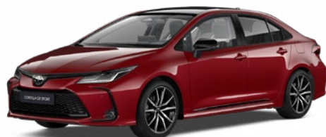
2TB GR-S érzéki vörös felár nélkül – GR SPORT