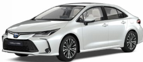
089 Platina gyöngyfehér** 300 000 Ft