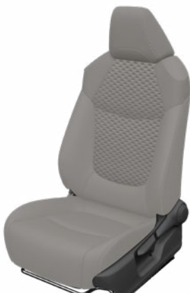
Világosszürke szövet ülésborítás bőr részekkel és steppelt szürke betétekkel, szürke varrással Alapfelszereltség Hybrid Executive felszereltségnél