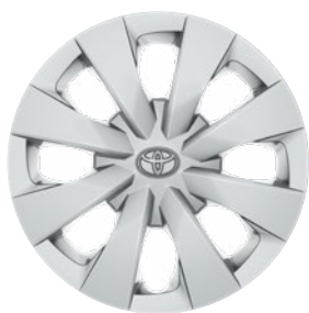
15" acél keréktárcsák díztárcsával (8 küllős) Alapfelszereltség az Active, Hybrid Active felszereltségnél