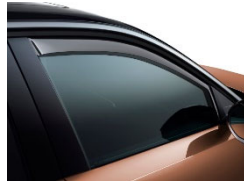
Légterelő első ajtóra, 2db-os szett