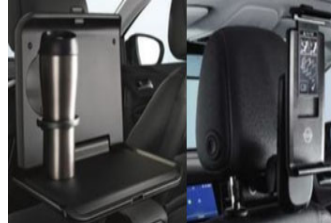
1 asztalka + 1 univerzális tablet tartó + 2 csatlakozó