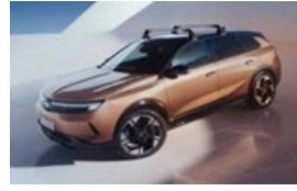
Keresztirányú tetőrudak hosszanti tetősínhez