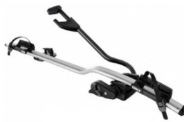
Expert 298 1-db-os kerékpártartó