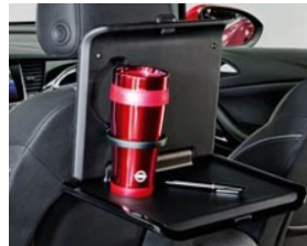
2 pohártartós asztalka 2 moduláris csatlakozó