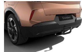
Szerszám nélkül leszerelhető vonóhorog 13 pólusú csatlakozóval