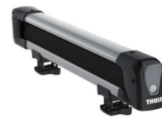
Snowpack 7324 tartó: 4 db síléc / 2 db snowboard