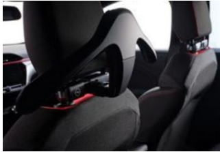
FlexConnect moduláris csatlakozó és vállfa