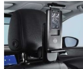
2 univerzális tablet tartó 2 moduláris csatlakozó