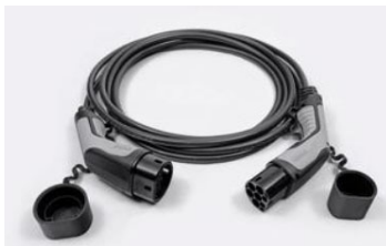
7,4 kW, 1 fázisú Type 2 kábel