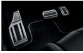
Alumínium pedálborítás, lábpihentetővel