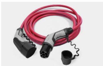
22 kW, 3 fázisú Type 2 kábel