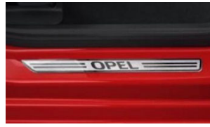
Első alumínium hatású Opel küszöbborítás