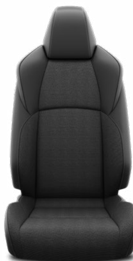
Szövet ülésborítás, szintetikus bőr betétekkel Alapfelszereltség: Style