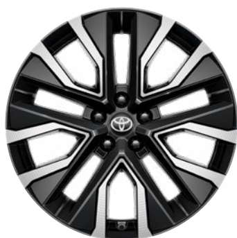
20" könnyűfém keréktárcsák, aero betétekkel Alapfelszereltség: Executive