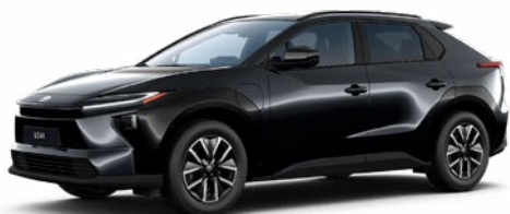
218 Fekete gyöngyház 280 000 Ft