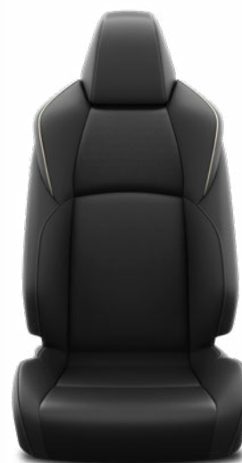
Vegán bőr ülésborítás Alapfelszereltség: Executive