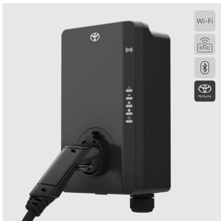
22 kW-os 3 fázisú AC töltő, 4G kapcsolat nélkül (5 m-es töltőkábelrel)