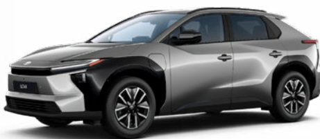
1L5 Nikkel ezüst 455 P 390 000 Ft