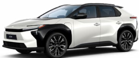
2PS Platina gyöngyfehér, fekete tetővel 55 P felár nélkül Executive VIP felszereltséghez rendelhető