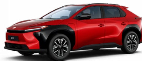
3U5 Érzéki vörös 55 P 390 000 Ft