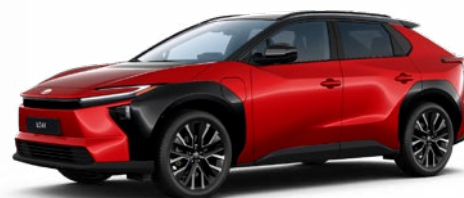
2SC Érzéki vörös, fekete tetővel 55 P felár nélkül Executive VIP felszereltséghez rendelhető