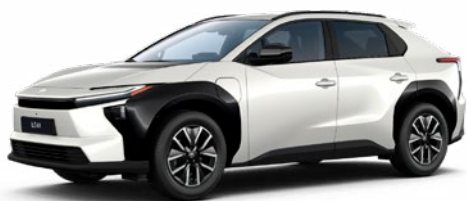
089 Platina gyöngyfehér 55 P 390 000 Ft