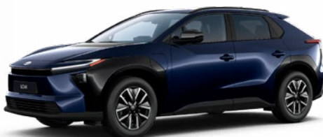
8X8 Éjkék 8 felár nélkül