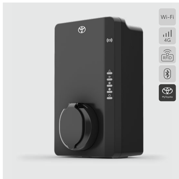
22 kW-os 3 fázisú AC töltő, 4G kapcsolattal és 10 éves adatcsomaggal (kábel nélkül)

További otthoni töltő ajánlatainkról érdeklődjön Toyota márkakereskedőjénél! Tudjon meg többet a Toyota otthoni töltőkről!