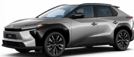
2YJ Nikkel ezüst, fekete tetővel 55 P felár nélkül Executive VIP felszereltséghez rendelhető