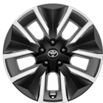
18" könnyűfém keréktárcsák, aero betétekkel Alapfelszereltség: Style